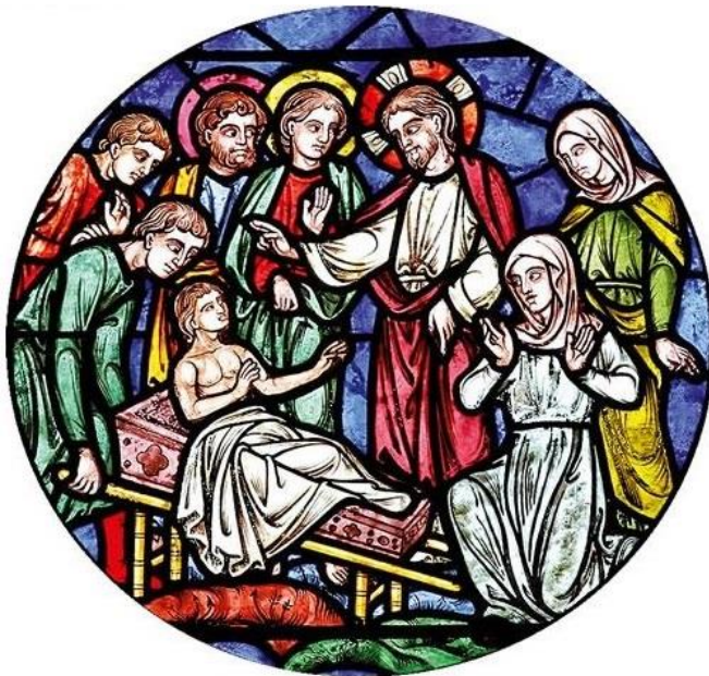
(cattedrale di Le Mans)

La “buona notizia” raggiunga anche noi oggi. Ciò che conta è saper vedere, saper accogliere, saper affidarsi ; in altri termini, è necessaria la fede.