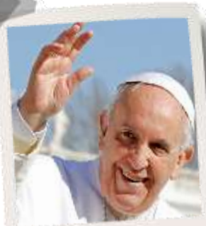
Papa Francesco e la Confessione