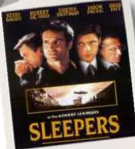
Sleepers per i gimi grandi