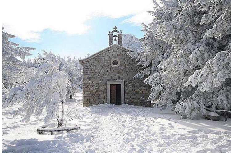
(Madonna della neve - Limbara)

Venero la Parola di Dio, l'Icona e il Crocefisso. Traccio sulla mia persona il Segno della mia fede, il Segno della Croce, mi metto alla presenza del Signore che vuole parlarmi.