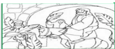
Domenica delle Palme