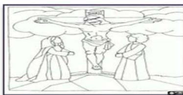
Morte in Croce