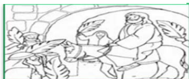
Domenica delle Palme