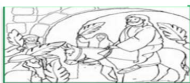
Domenica delle Palme