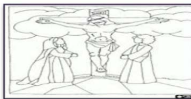
Morte in Croce