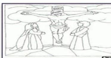
Morte in Croce